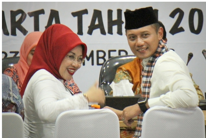
Bakal Calon Gubernur DKI Agus Harimurti Yudhoyono (kanan) dan Bakal Cawagub Sylviana Murni (kiri) saat pendaftaran di KPU DKI Jakarta, Jumat (23/9).